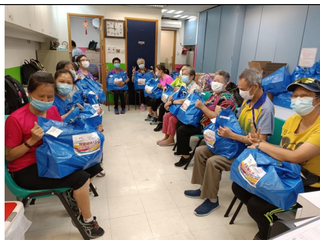
馬車會所慈善基金有限公司送出福袋