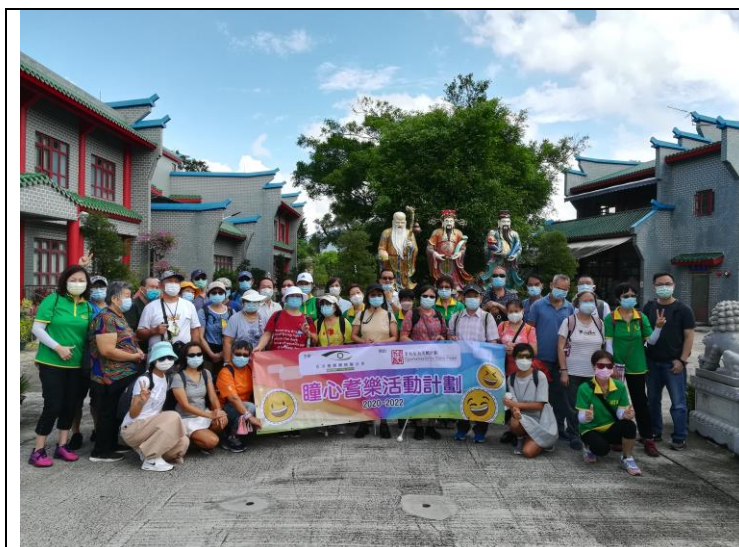
「老有所為2020」瞳心耆樂-戶外旅行