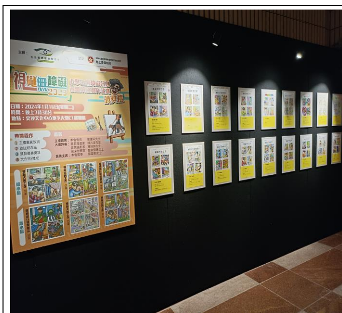
無障礙資訊公眾展覽

所有漫畫得獎作品將連同本會3位視障會員拍攝的無障礙設施相片由2024年1月15日至1月17日於文化中心大堂一同展出。