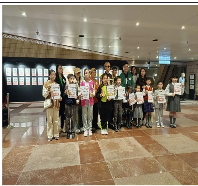
無障礙資訊得獎學生