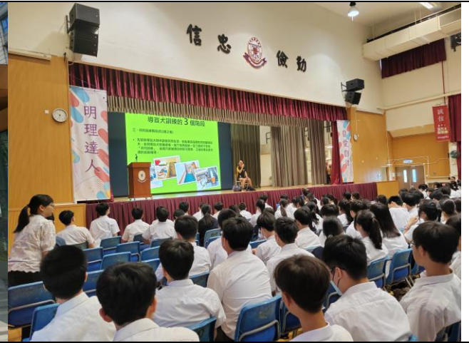
視障資訊教育講座