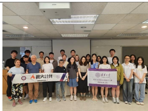
視障資訊教育講座