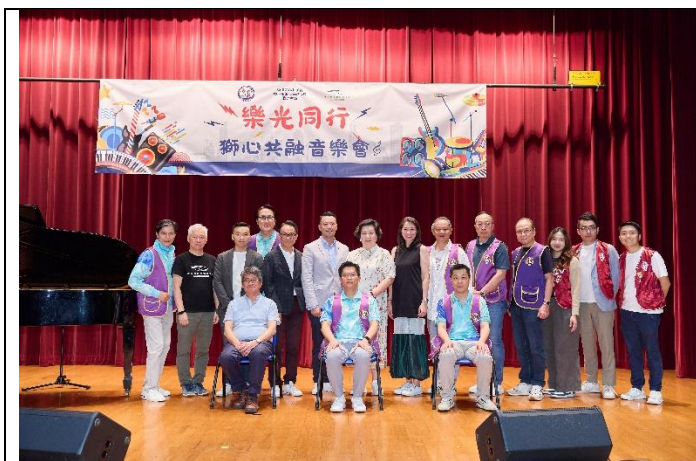
樂光同行-獅心共融音樂會剪影