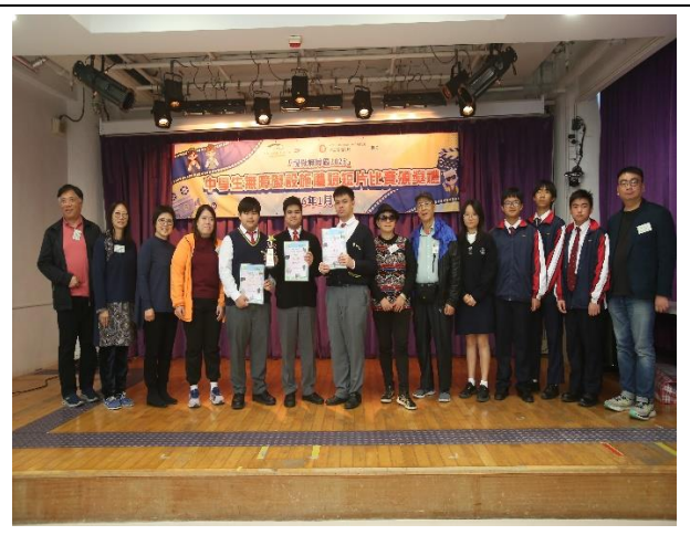
無障礙設施體驗短片比賽得獎學生