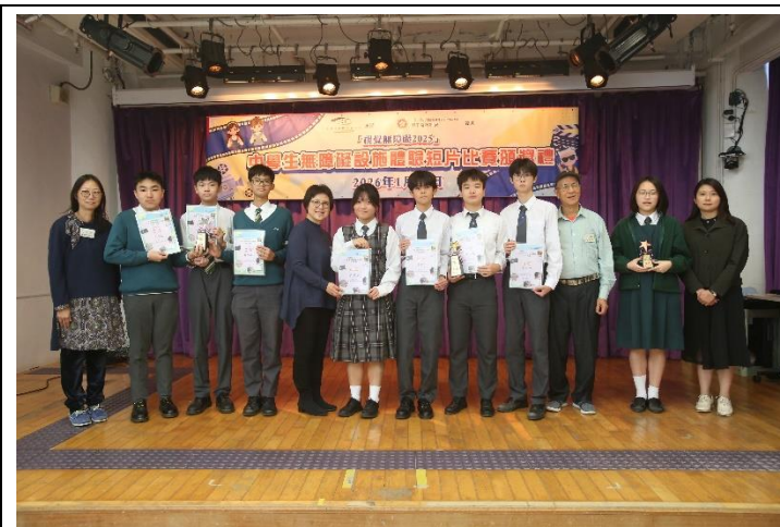
無障礙設施體驗短片比賽活動剪影

比賽頒獎禮於2026年1月17日假香港盲人輔導會8樓禮堂舉行。當日由本會多位理事，比賽評審主禮及頒發優勝獎品。