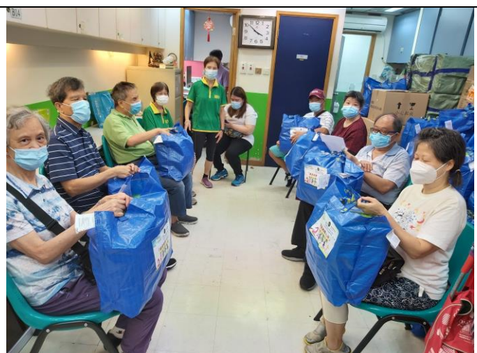
香港賽馬會慈善基金送出防疫福袋