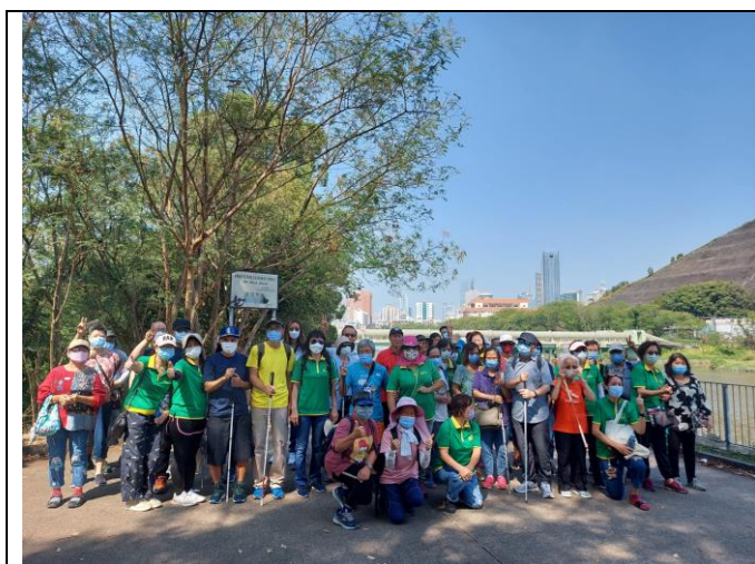
新界一日遊-鳴謝歡樂友義工團主辦